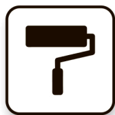
Силиконовый (резиновый) валик для прикатки