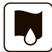
Чистая влажная тряпочка