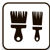
Кисточки для клея (узкая и широкая)